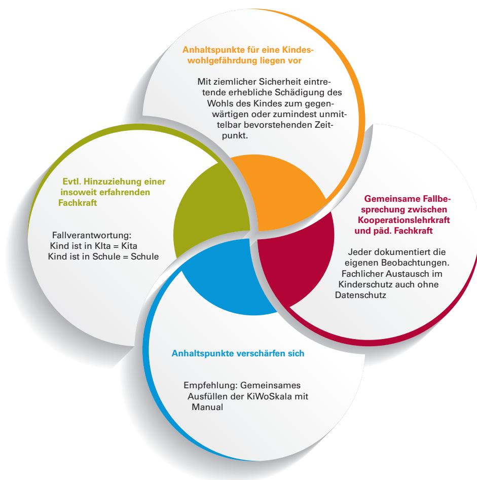
Abbildung: Verfahren im Kinderschutzfall

Fallverantwortlich im Kinderschutz ist die Kindertageseinrichtung. Bei einem erfolgten Wechsel in die Schule geht die Fallverantwortung dorthin über.