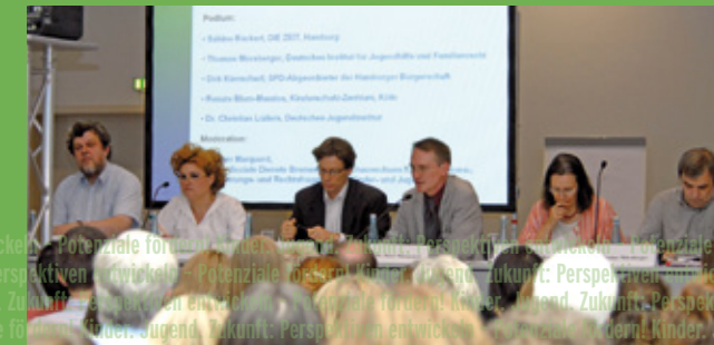
Fachkongress 13. Deutscher Kinder- und Jugendhilfetag 2008

Der Fachkongress fördert den Austausch von Politik, Wissenschaft und Theorie und Praxis der Kinder- und Jugendhilfe. Er dient der fachlichen Weiterentwicklung und hat Fortbildungscharakter. Informationen zu den Veranstaltungen finden Sie unter www.jugendhilfetag.de unter dem Link Programm/Fachkongress oder im Veranstaltungskalender.