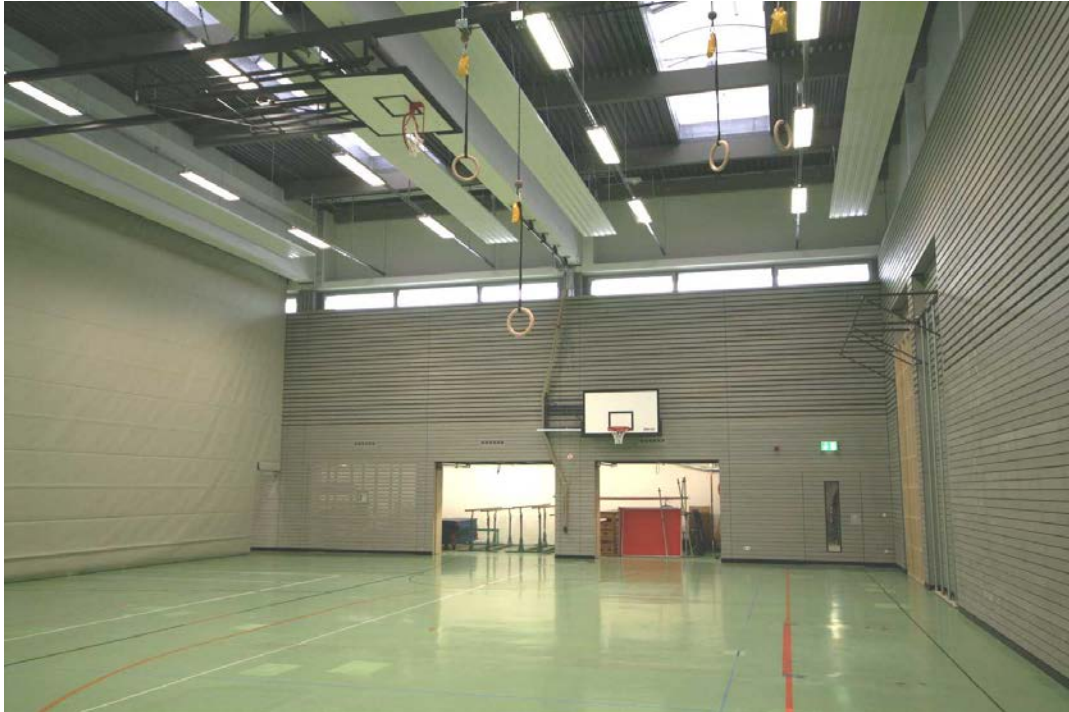
2. Bauabschnitt (Teilbereich des Hallenraums)