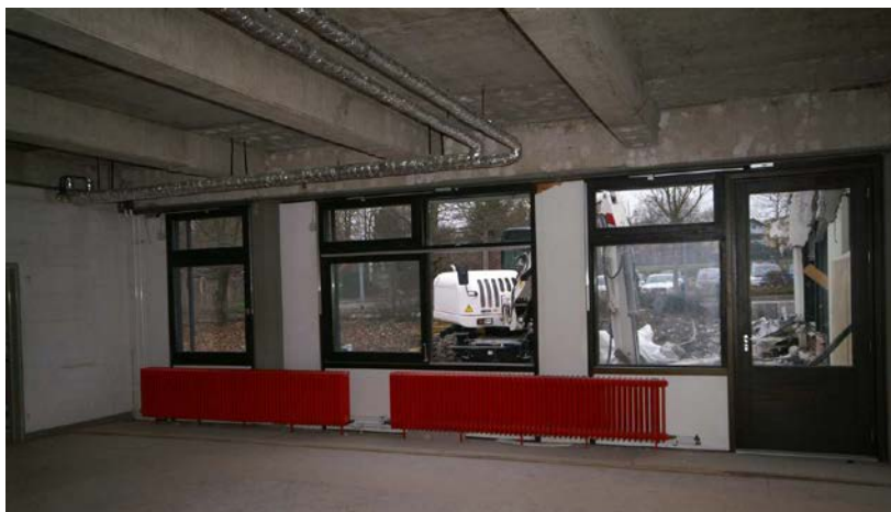
3. Bauabschnitt (Werkbereich bereits ohne Möblierung)

Die Submission des 2. Ausschreibungspakets für weitere 9 Gewerke erfolgte am 07.02.2012. Die Angebote sind momentan noch nicht geprüft.