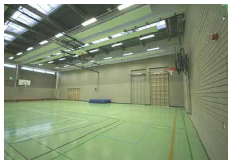
2. Bauabschnitt / (Teilansicht Hallenraum)