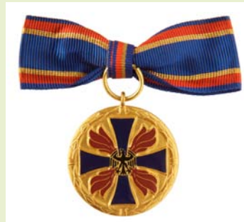
Deutsche Feuerwehr-Ehrenmedaille, Damen