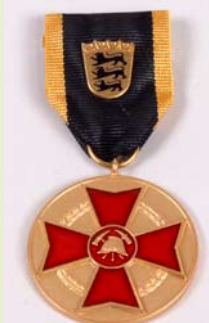
LFV Ehrenmedaille, Gold