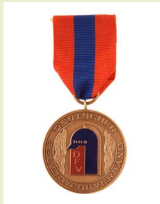
Medaille für internationale Zusammenarbeit, Bronze