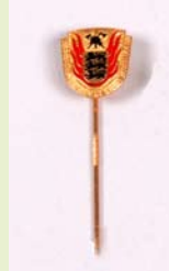
LFV Ehrennadel, Gold