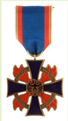
Deutsches Feuerwehr-Ehrenkreuz, Bronze