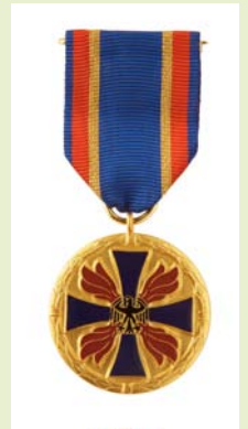
Deutsche Feuerwehr-Ehrenmedaille, Herren