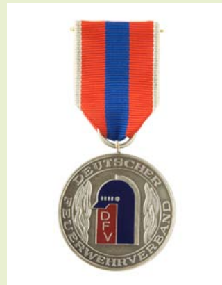
Medaille für internationale Zusammenarbeit, Silber