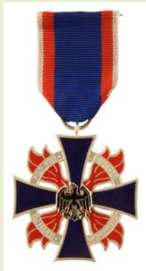
Deutsches Feuerwehr-Ehrenkreuz, Silber