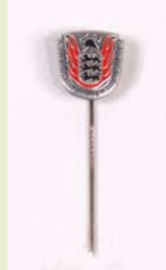
LFV Ehrennadel, Silber