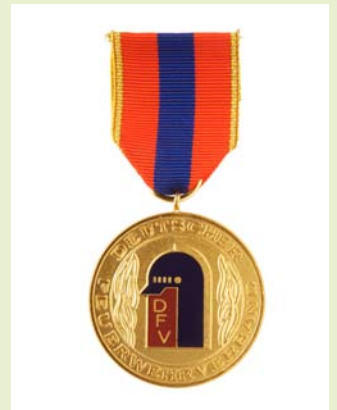
Medaille für internationale Zusammenarbeit, Gold