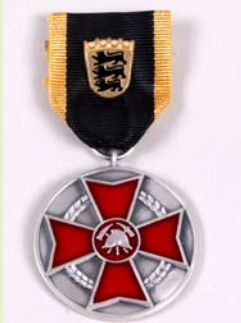
LFV Ehrenmedaille, Silber