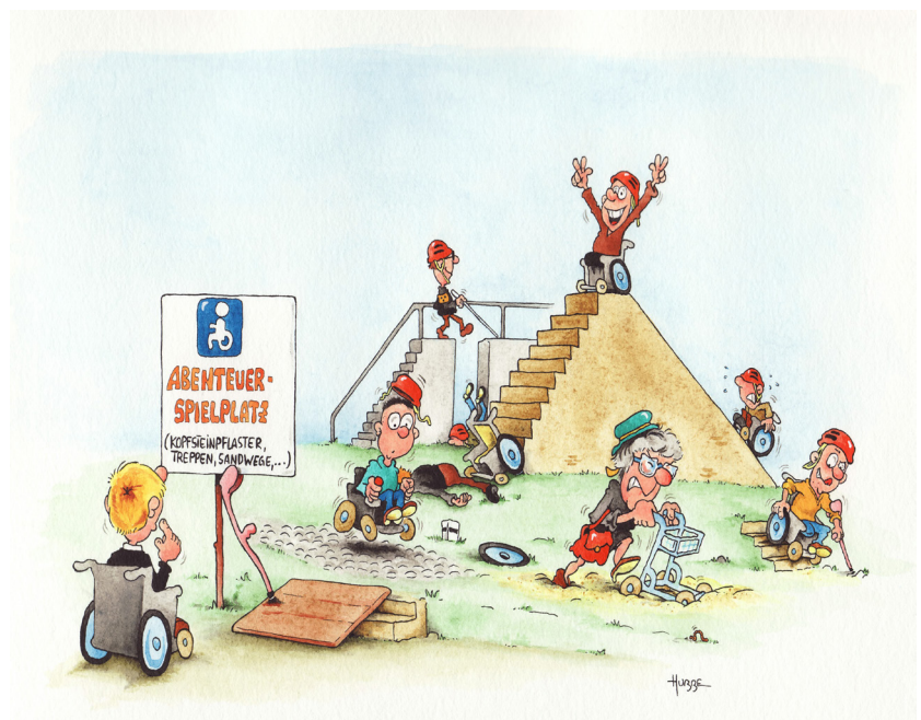
Cartoon Phil Hubbe: Abenteuerspielplatz für Rollstuhlfahrer, Personen mit Rollatoren und mit Blindenstock

Weitere interessante Fragestellungen waren: Brauchen wir mehr Rollstuhltaxen? Wie geht man mit erkannten Barrieren am Fernbusbahnhof um? Wie ist der Stand des Ausbaus barrierefreier Bushaltestellen im Landkreis?