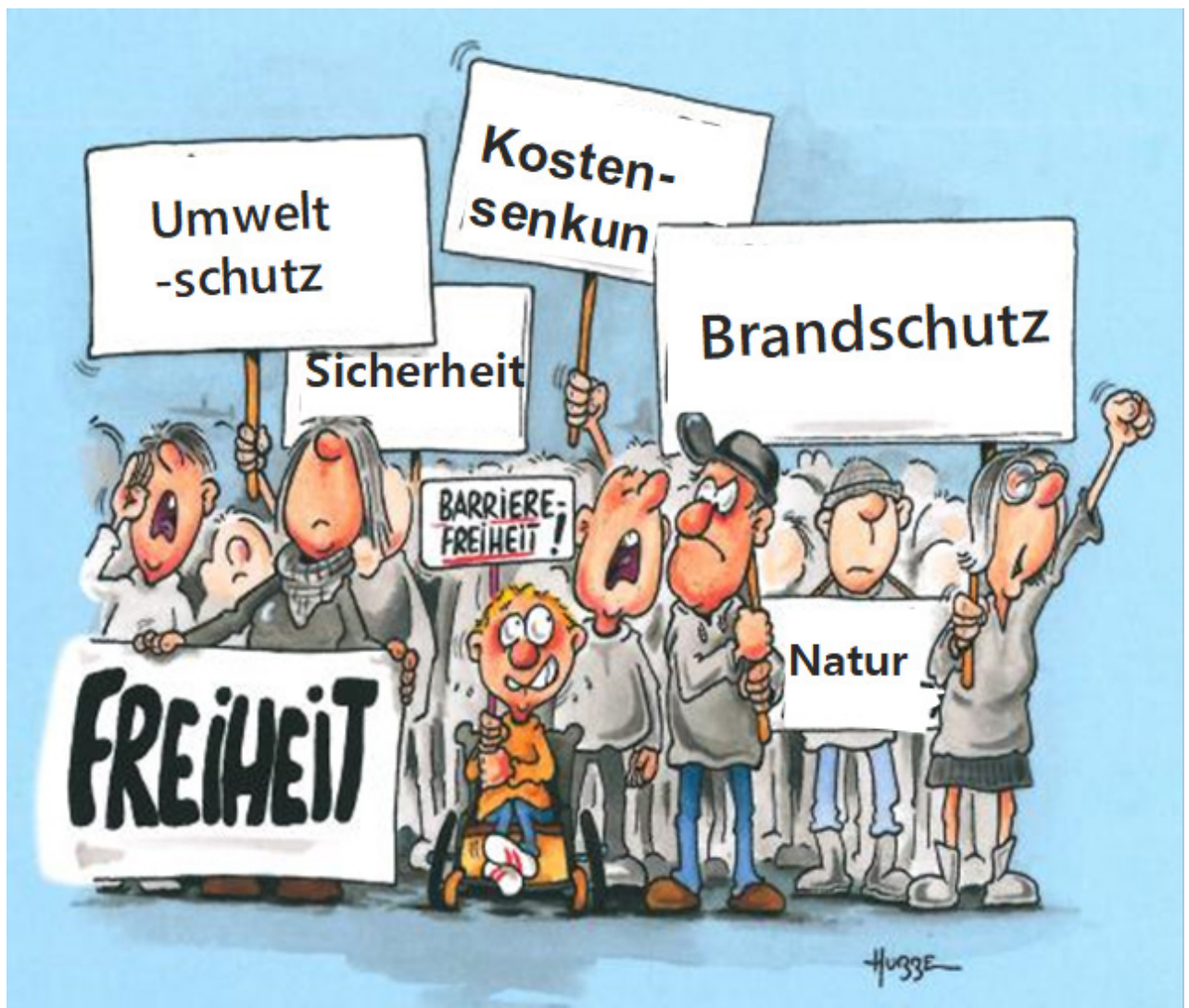
Cartoon von Phil Hubbe: Thema Barrierefreiheit – auch ein wichtiges Thema! (Themen etwas angepasst)